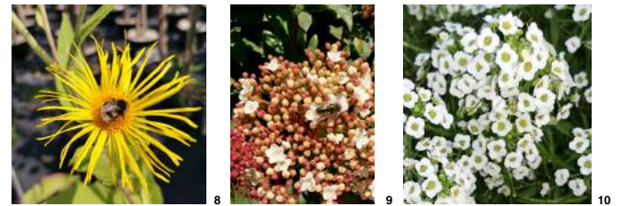
Photos 8 à 10 de gâd : fleurs de la Grande Aunée, du Laurier-tin et de l'alyse maritime.