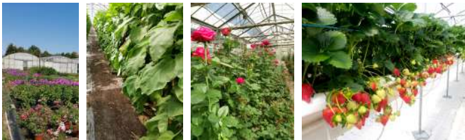
Photos 1 et 4 de gâd : pépinière de rosiers paysagers, aubergine en AB, rose fleur coupée et fraisier en hors-sol

Depuis 2020, le projet a été conduit simultanément sur les quatre agro-systèmes suivants : rosier paysager, aubergine en AB, rose fleur coupée et fraisier en hors-sol (photos 1 à 4).