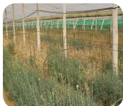
Culture naturellement infectée avec Fusarium oxysporum f. sp. dianthi