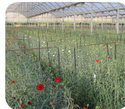
Serre commerciale traitée avec Asperello